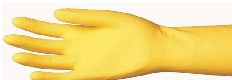
Για καθαρισμό των Θαλάμων