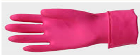
Για καθαρισμό της Τουαλέτας (WC)