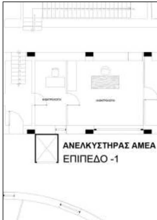
Σκαρίφημα 1: Χώρος που θα τοποθετηθεί ο νέος ανελκυστήρας (Επίπεδο -1)