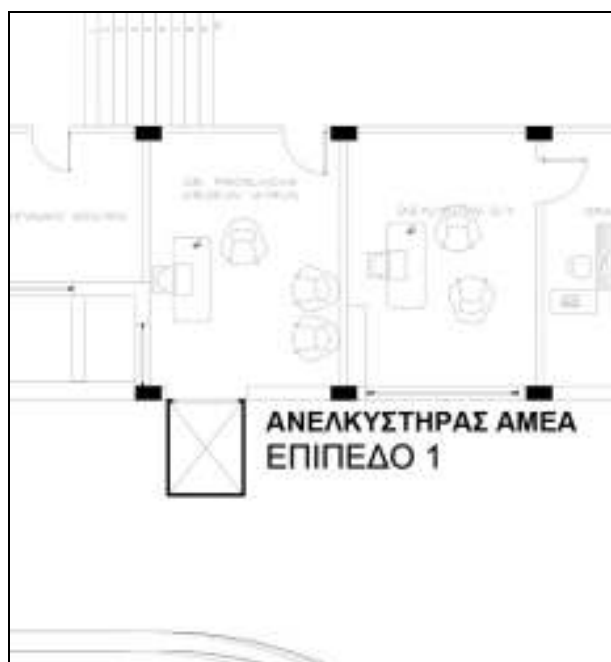
Σκαρίφημα 3: Χώρος που θα τοποθετηθεί ο νέος ανελκυστήρας (Επίπεδο 1)