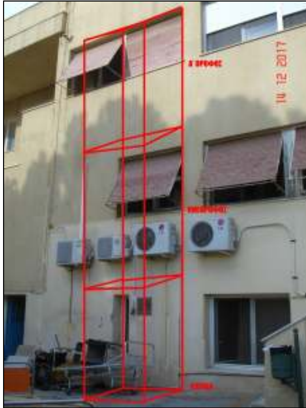
Φωτογραφία 1: Χώρος που θα τοποθετηθεί ο νέος ανελκυστήρας