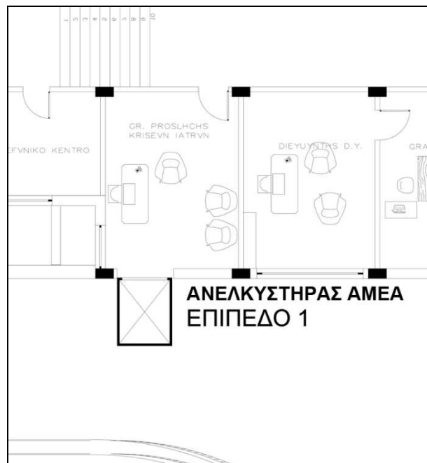
Σκαρίφημα 3: Χώρος που θα τοποθετηθεί ο νέος ανελκυστήρας (Επίπεδο 1)