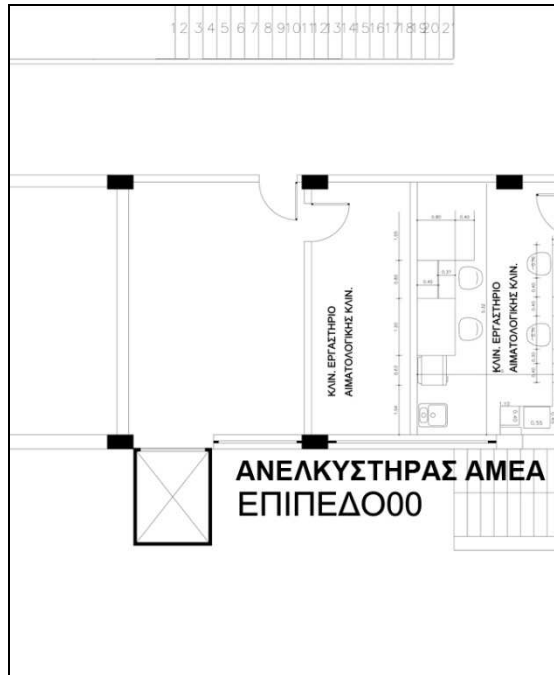
Σκαρίφημα 2: Χώρος που θα τοποθετηθεί ο νέος ανελκυστήρας (Επίπεδο 0)