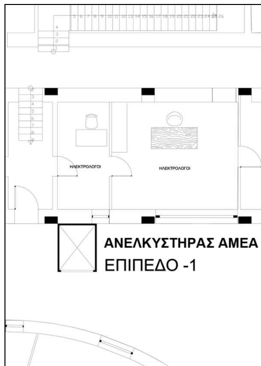
Σκαρίφημα 1: Χώρος που θα τοποθετηθεί ο νέος ανελκυστήρας (Επίπεδο -1)