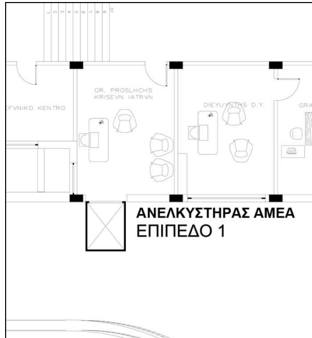
Σκαρίφημα 3: Χώρος που θα τοποθετηθεί ο νέος ανελκυστήρας (Επίπεδο 1)

ΕΛΛΗΝΙΚΗ ΔΗΜΟΚΡΑΤΙΑ ΥΠΟΥΡΓΕΙΟ ΥΓΕΙΑΣ & ΚΟΙΝΩΝΙΚΗΣ ΑΣΦΑΛΕΙΑΣ - ΔΙΟΙΚΗΣΗ 1ης ΥΠΕ ΑΤΤΙΚΗΣ ΓΕΝΙΚΟ ΝΟΣΟΚΟΜΕΙΟ ΑΤΤΙΚΗΣ ΣΙΣΜΑΝΟΓΛΕΙΟ - ΑΜΑΛΙΑ ΦΛΕΜΙΓΚ Ν.Π.Δ.Δ.