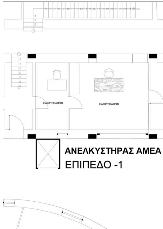
Σκαρίφημα 1: Χώρος που θα τοποθετηθεί ο νέος ανελκυστήρας (Επίπεδο -1)