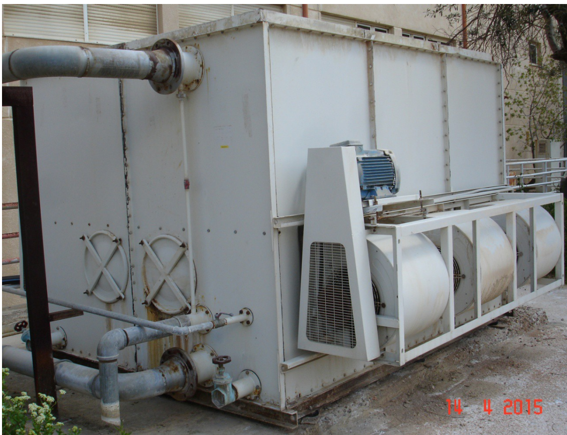
Φωτ 1-2: Υπάρχων πύργος ψύξης