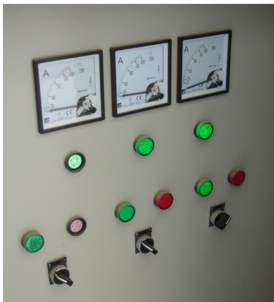
Φωτ. 5: Υπάρχων ηλεκτρικός πίνακας