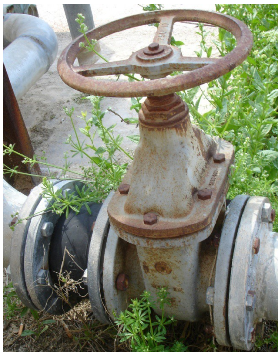
Φωτ. 6: Υπάρχουσες βάνες αποκοπής και διαστολικοί σύνδεσμοι